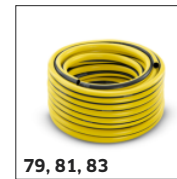
79, 81, 83