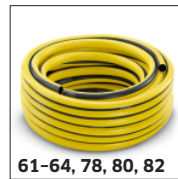
61-64, 78, 80, 82