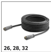
26, 28, 32