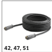
42, 47, 51