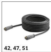
42, 47, 51