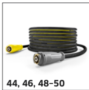
44, 46, 48-50