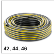
42, 44, 46