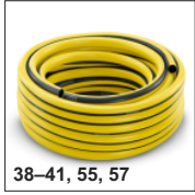
38-41, 55, 57