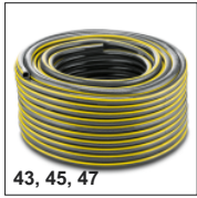
43, 45, 47