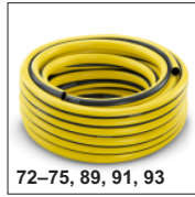
72-75, 89, 91, 93